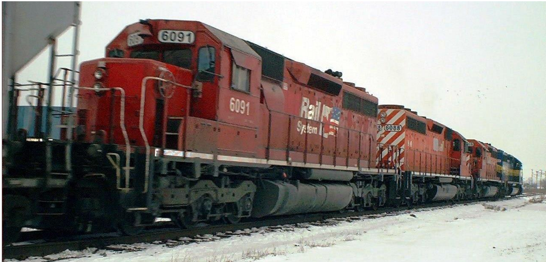
Illustration pour la classe