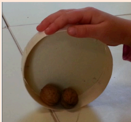
Autre fabrication possible

Ces défis sont proposés par les équipes du réseau des Centres pilotes La main à la pâte