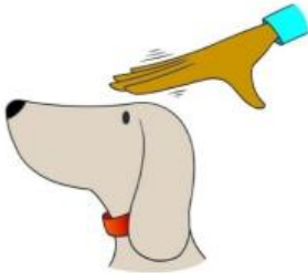
tap on the head