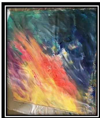
Impressions cycle 2