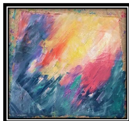
Impressions cycle 3