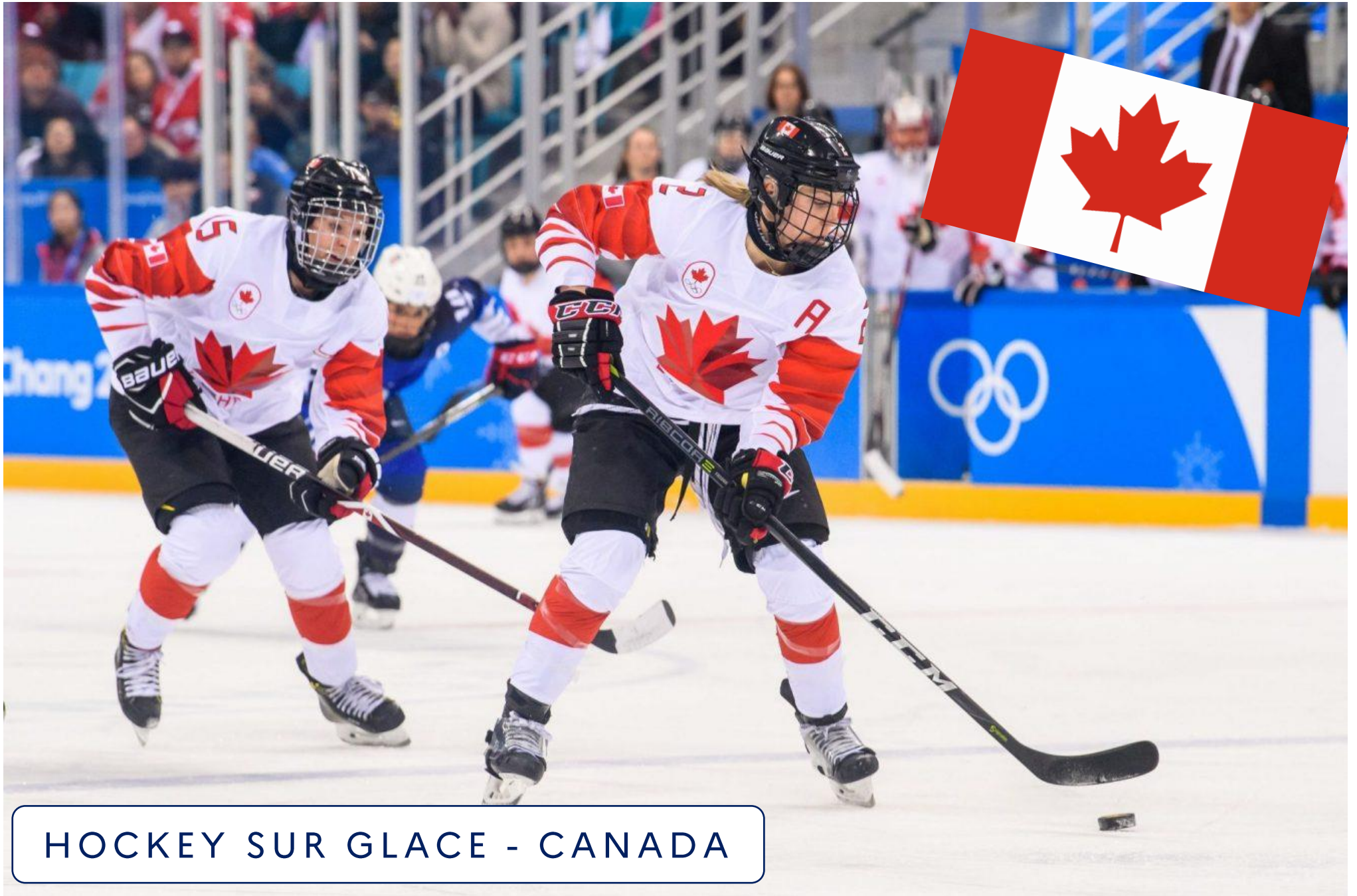
HOCKEY SUR GLACE - CANADA