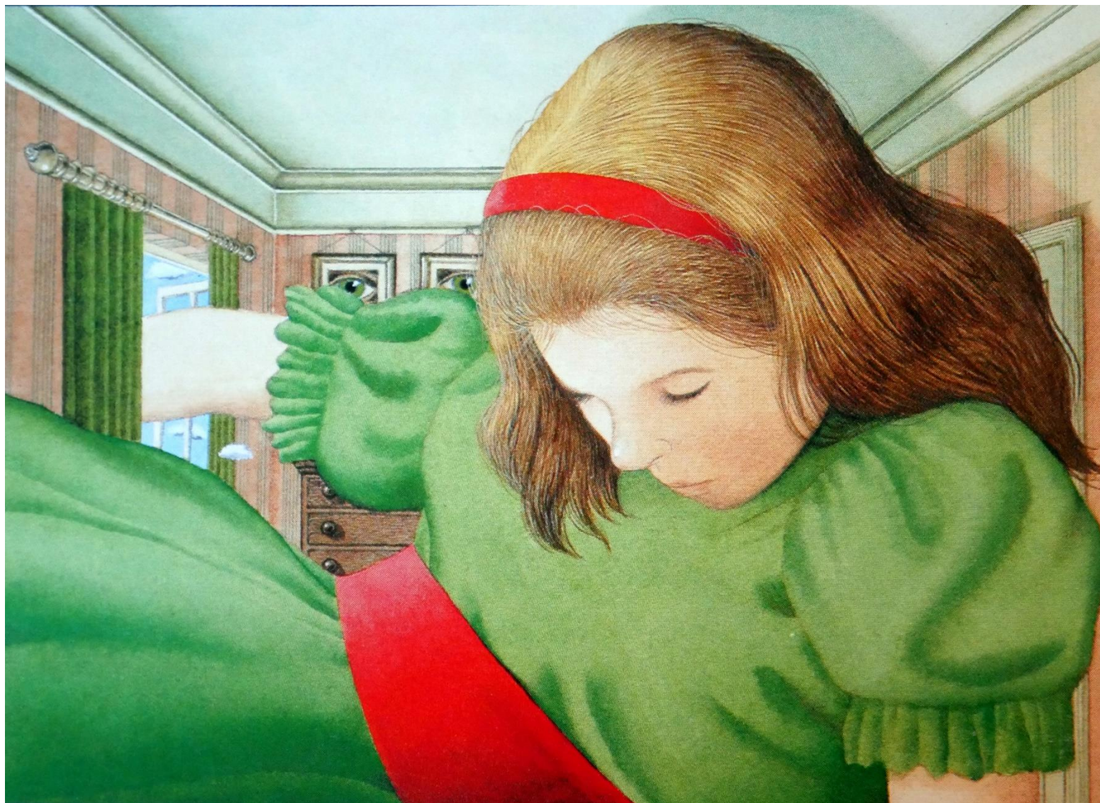
Anthony BROWNE Kaléidoscope 1988