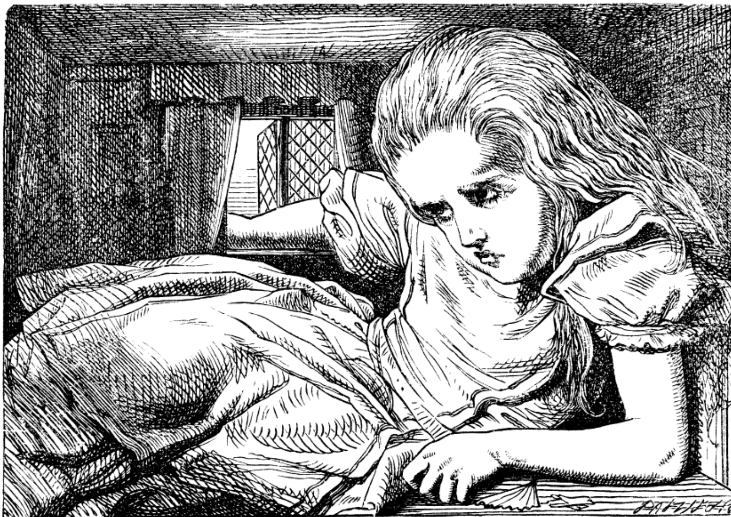
John TENNIEL 1865