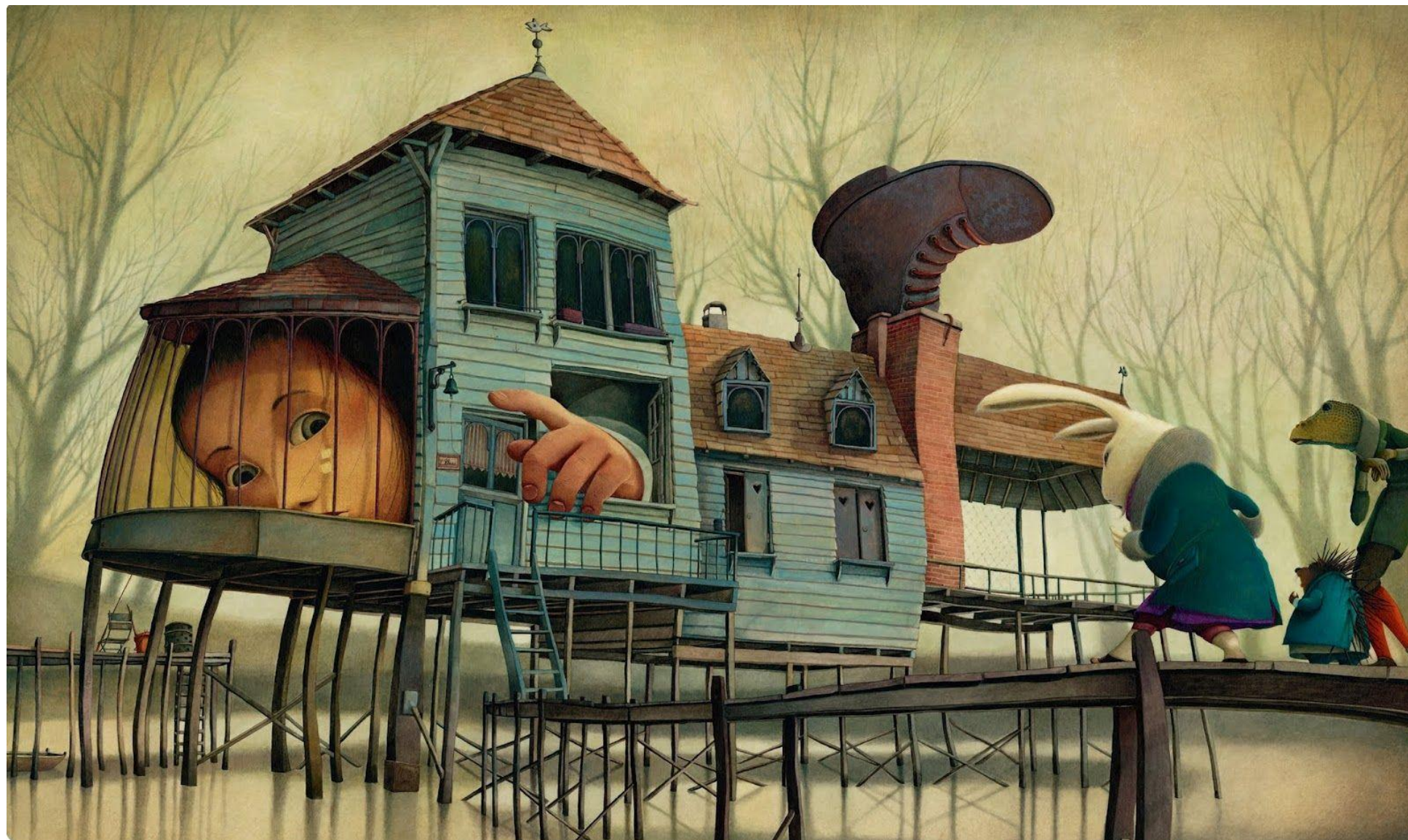
Rebecca DAUTREMER Gautier-Languereau 2010