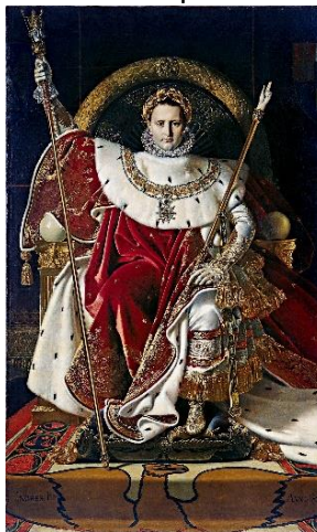
Jean-Dominique Ingres Napoléon Ier sur le trône impérial 1806

On amènera les élèves à prendre conscience des caractéristiques d'un portrait d'apparat : le portrait d'apparat est la représentation symbolique du pouvoir donc il est important de respecter les points suivants : somptuosité de la parure, solennité du décor, idéalisation, sens du détail.