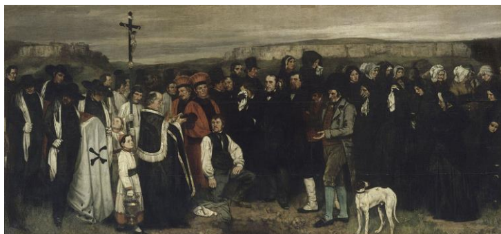
Gustave Courbet, « Un enterrement à Ornans », 1849

Ce type d'analyse peut être mené à partir d'autres documents par exemple une photographie de foule ou plus près des élèves, la photographie de classe.