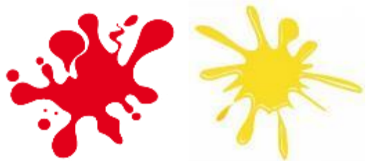
ROUGE ou JAUNE