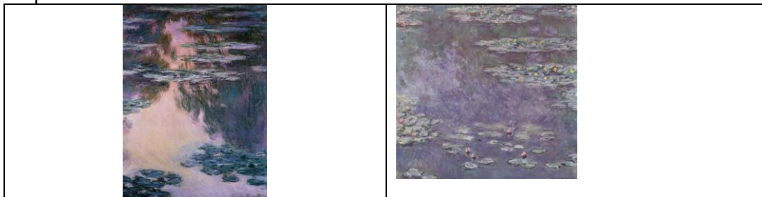
Claude Monet, Nymphéas