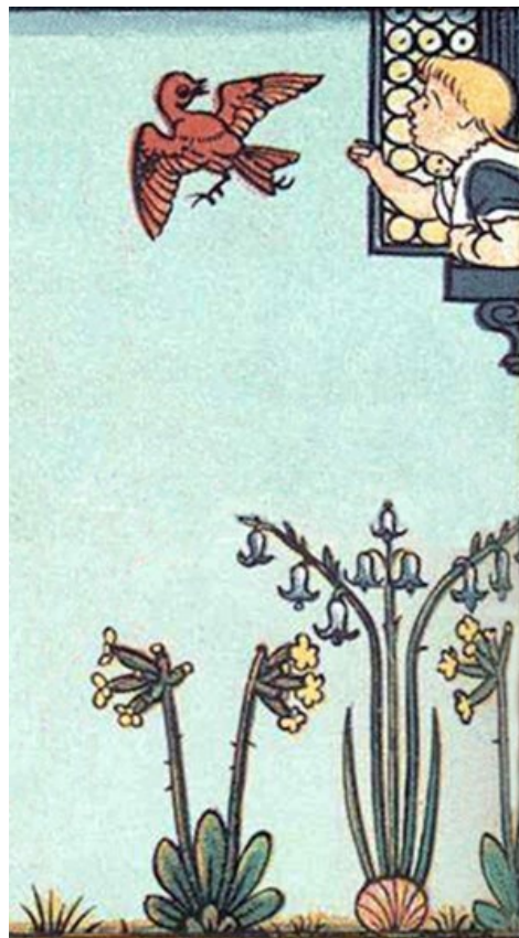
Illustration de walter Crane