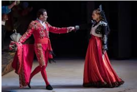
Escamillo et Carmen

Questions : Le maître demande aux enfants de reconnaître les personnages puis d'évoquer les situations supposées.