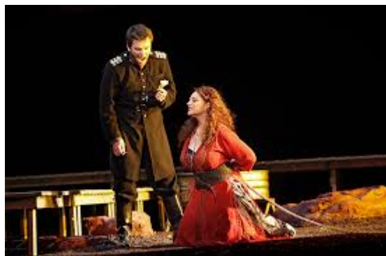
Don José et Carmen