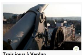
Trois jours à Verdun

Proposition de sorties avec nuitées parmi les parcours thématiques orientés sur la 1 ère guerre mondiale