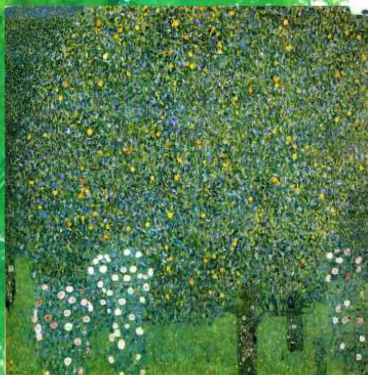
Roses under the Trees Vassily KANDINSKY 1905