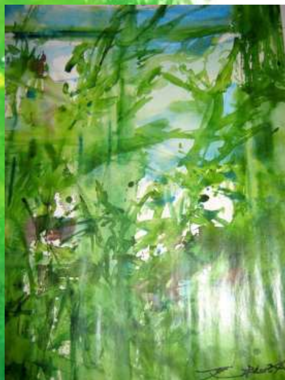
Summertime ZAO WOU-KI