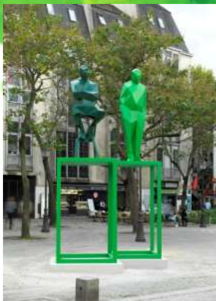
"Renzo Piano & Richard Rogers" sur la Place Edmond Michele 2013 XAVIER VEILHAN