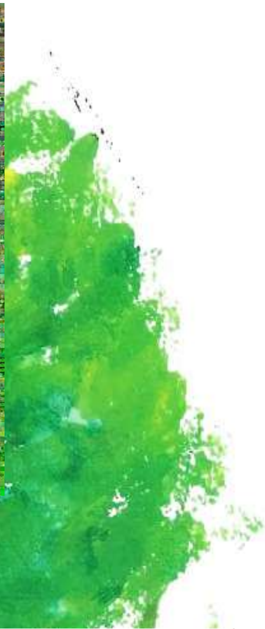
Monochrome(s) V. tirage lambda sur diasec avec chassis aluminium, Reynald Drouhin 2006