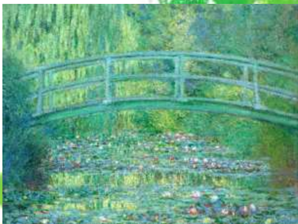
Le Bassin aux Nymphéas, Claude MONET 1899