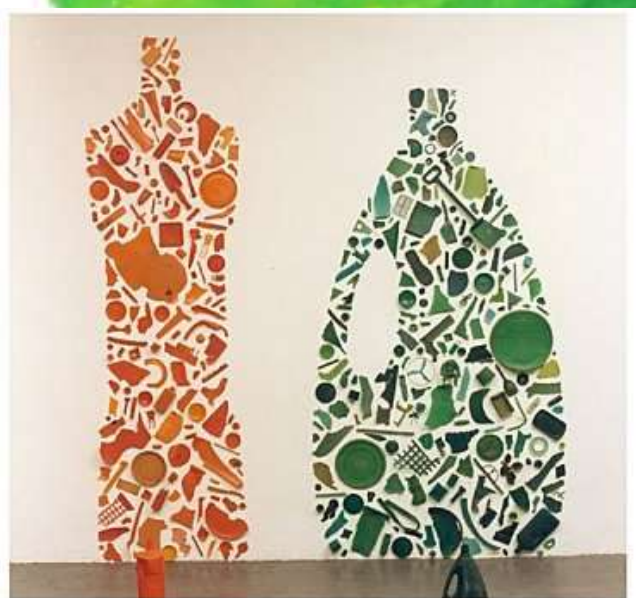
Sans titre Tony CRAGG 1980