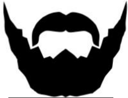
ein Bart (M)