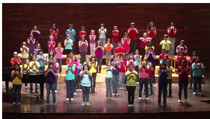
Niños Cantores de Cozumel