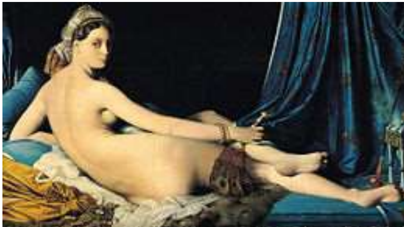
https://fr.wikipedia.org/wiki/Fichier:800px-Jean Auguste Dominique Ingres, La Grande Odalisque, 1814.jpg

Martial Raysse s'inspire de La Grande Odalisque , œuvre de J.-A. D. Ingres (1780-1867), peintre français néo-classique du XIXe siècle.