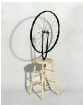
Marcel Duchamp : La Roue de Bicyclette , 1913

« Objet manufacturé promu au rang d'objet d'art par le seul choix de l'artiste. ».