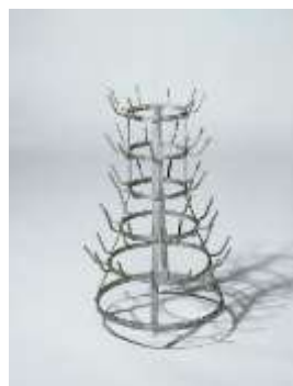
Porte-bouteilles , 1914

(1964) ( Séchoir à bouteilles ou Hérisson ).