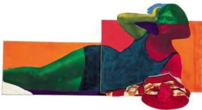
Soudain l'été dernier de Martial Raysse