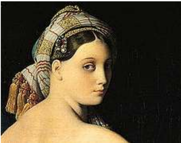
J.-A. D. Ingres, La Grande Odalisque , 1814

https://www.youtube.com/watch?v=zKOUc35iVg