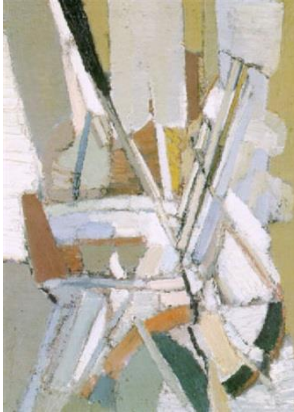
Nicolas de Staël, Jour de fête , 1949

Utiliser des lignes et des formes pour diriger le regard et exprimer la joie.