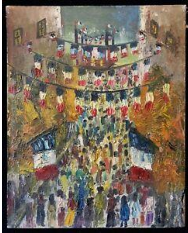
Saint Tropez 14 juillet

Cadrer en utilisant la plongée pour mettre en évidence la foule réunie autour d'un événement.