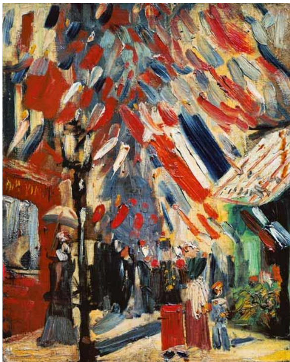
Vincent Van Gogh, la fête du 14 juillet à Paris , 1886

Grâce à des gestes amples ou au contraire contraints laisser des traces vives sur le support pour figurer le mouvement d'éléments manifestant la joie (mouvements de drapeaux, banderoles, fanions...).