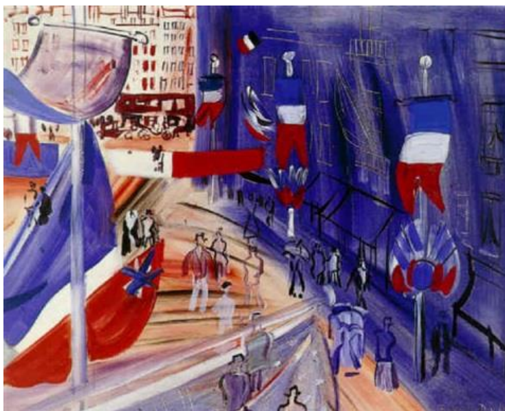
Raoul Dufy, La rue pavoisée à la bannière américaine , 1930

Utiliser des couleurs vives qui expriment la joie (couleurs chaudes, couleurs républicaines...).