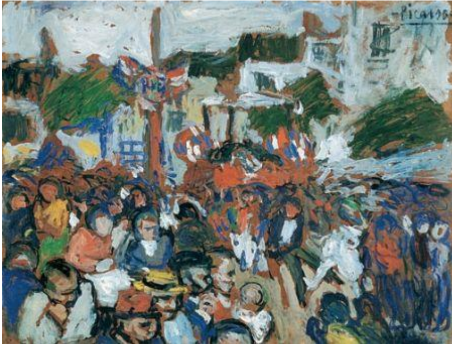
Pablo Picasso, Le 14 juillet , 1901

http://talent.paperblog.fr/8441237/14-juillet-et-les-peintres/