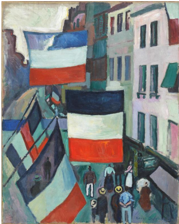
Raoul Dufy, Rue pavoisée, le 14 juillet au Havre , 1906

Représenter des éléments ou des moments qui participent à la joie collective.