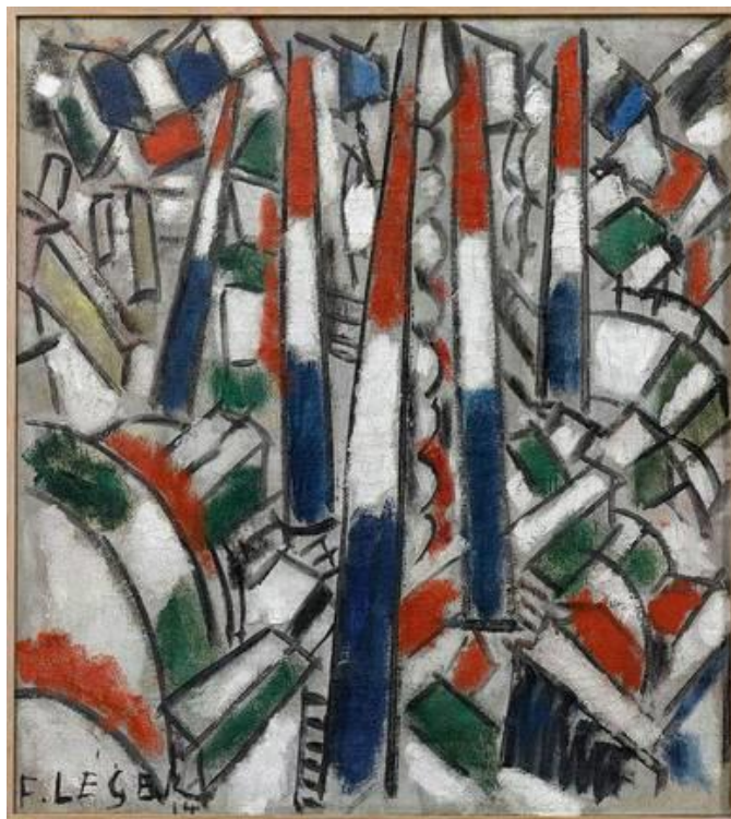
Fernand Léger, 14 juillet , 1914

Répéter des lignes et des éléments pour donner du dynamisme et évoquer la joie de la foule.