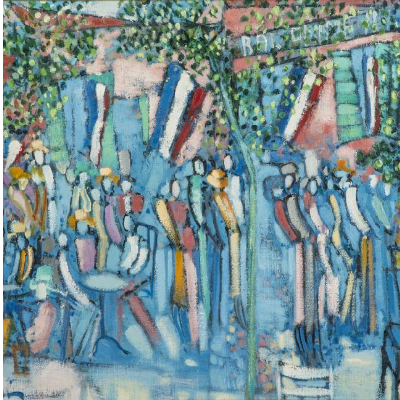
Gérard Blin, 14 juillet à Stillecione

Le bal, le bal populaire, la danse, la joie d'être ensemble comme sujet.